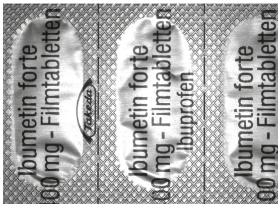
Rückseite eines Tablettenblisters - Aufsicht

Knackpunkt beim Verwenden dieser Beleuchtungsart ist der Arbeitsabstand. Um eine schattenfreie Ausleuchtung zu gewährleisten, muss dieser möglichst gering gehalten werden. Gewölbte und kugelförmige Objekte müssen sogar teilweise in die Beleuchtung eintauchen.