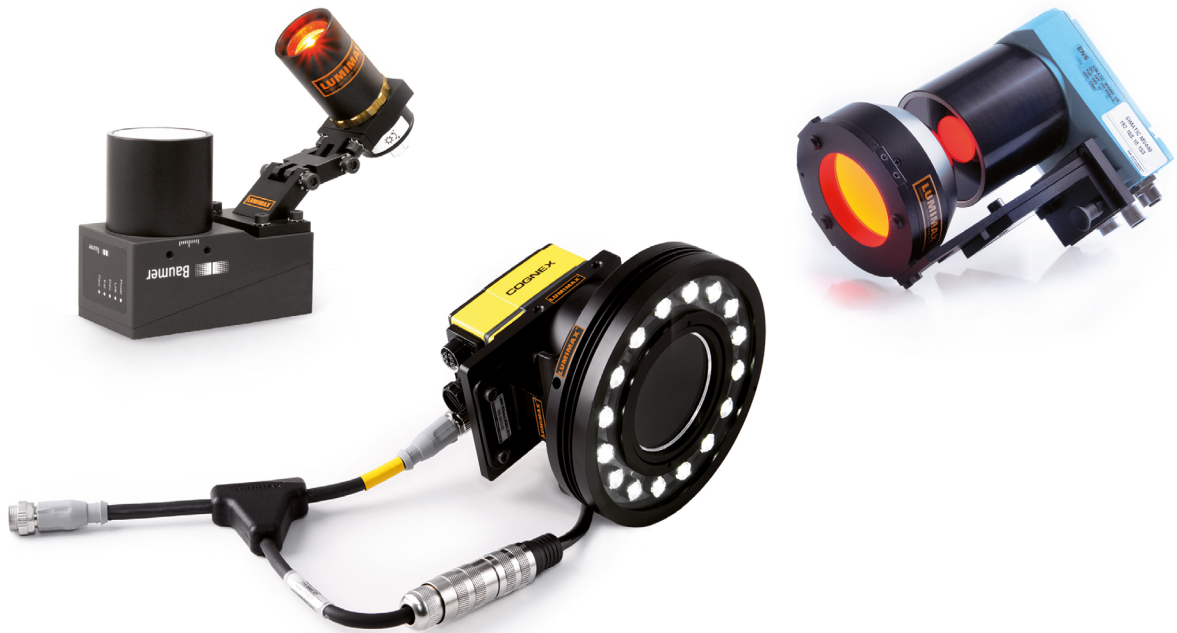
Montagelösungen mit Kamera und Beleuchtung

Beleuchtungs- technik für Shape-from- Shading