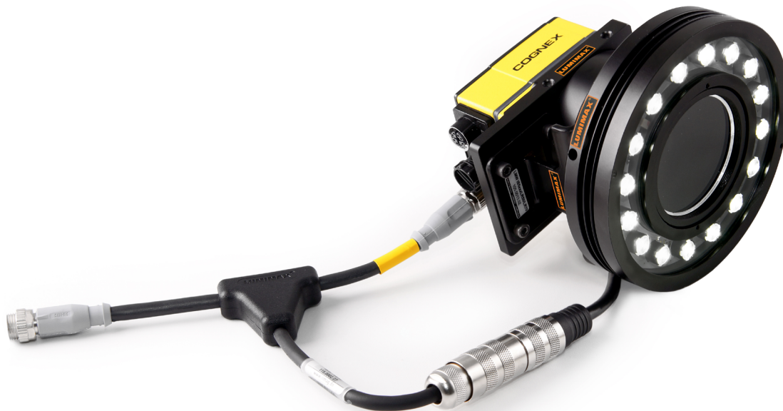
Kopplung von Kamera und LUMIMAX ® LED Ringbeleuchtung mittels T-Adapterkabel

Um dies zu realisieren, stellen viele Kamerahersteller einen höchstpriorisierten Blitzausgang zur Verfügung. Durch die Priorisierung des Blitzausgangs wird gewährleistet, dass das Blitzsignal immer synchron zur Bildaufnahme gesendet wird. Eine Verzögerung durch andere Rechenprozesse der Kamera ist nicht möglich. Andernfalls könnte es passieren, dass die Beleuchtung ihr Signal erst nach der Bildaufnahme erhält. Das Bild wäre dadurch nicht ausreichend bzw. gar nicht belichtet.