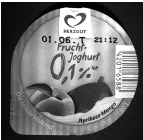
Aluminiumdeckel für Joghurtbecher unter weißem Licht

Doch nicht nur im Zusammenspiel mit farbigen Prüfobjekten spielt die langwellige Infrarotstrahlung eine wichtige Rolle. Infrarotbeleuchtungen können auch dazu genutzt werden, bestimmte Materialien zu durchleuchten. Dieses Verfahren kommt zum Beispiel bei der Durchlichtkontrolle auf Transportbändern zum Einsatz. Ebenso zum Fremddichtausschluss in Verbindung mit speziellen Filtern kann Infrarotstrahlung verwendet werden. Diese Möglichkeit werden wir in Kapitel 3 näher erläutern.