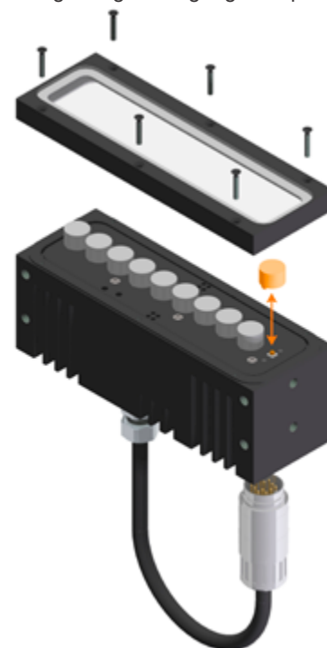
Linsenwechseloption des LUMIMAX ® Balkenlichts LB125