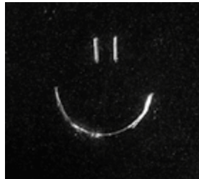
Kratzer auf Plexiglas - Dunkelfeld-Durchlicht