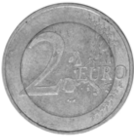
links: diffuses Auflicht