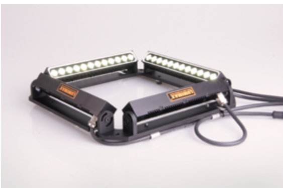
LUMIMAX® Balkenbeleuchtungen der LSB-Serie im Montagerahmen

Welche Variante benutzt wird, ist zum einen abhängig vom Prüfobjekt selbst, aber auch von den Einbaubedingungen vor Ort. Da die Dunkelfeldbeleuchtung aufgrund des flach einstrahlenden Lichts mit einem sehr kleinen Arbeitsabstand arbeitet, ist es nicht immer möglich, eine geschlossene Ringbeleuchtung zu verwenden. In diesen Fällen wird häufig auf eine Kombination von Balkenbeleuchtungen zurückgegriffen.