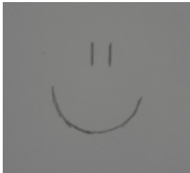
Kratzer auf Plexiglas - diffuses Durchlicht