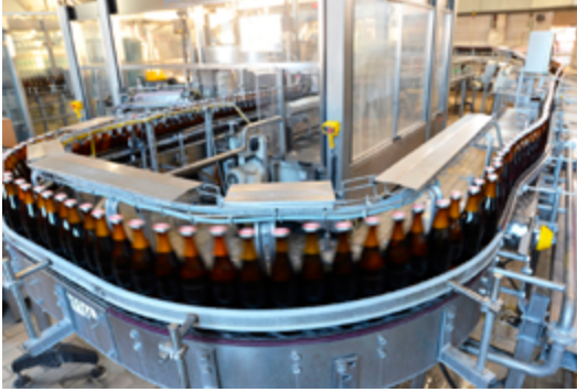
Beispiel einer industriellen Getränkeabfüllanlage

Durch die genannten Eigenschaften birgt die Verwendung einer Blitzbeleuchtung einige bedeutende Vorteile beim Einsatz in industriellen Abläufen. Besonders die Zeit- und Kostenersparnis durch die Prüfung im laufenden Prozess ist enorm. Gerade in der Produktion von Nahrungs- und Genussmitteln sind extrem schnelle Prozesse mit 30 bis sogar 80 Prüfungen / Sekunde keine Seltenheit. Ein Stopp des Produktes zur Qualitätsprüfung ist unmöglich.