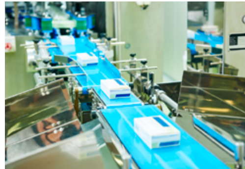
Verpackungskontrolle in der Pharmaindustrie

Ohne eine Blitzbeleuchtung zur Minimierung von Bewegungsunschärfe ist dies bei gleichbleibender Durchlaufzeit undenkbar.