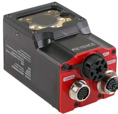
Keyence SR1000 bzw. Keyence SR2000