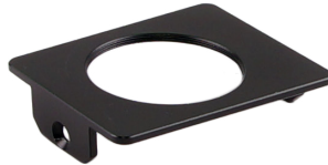
LUMIMAX® Filteradapter SR1000 - M30,5x0,5 Art.Nr.: 105.0022.01