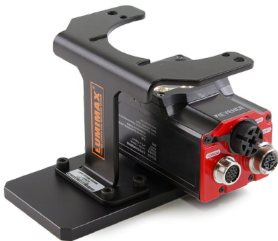
LUMIMAX® Montagewinkel LMW-SR1000 SR2000 | Art.Nr.: 105.0013.04 für LR50/FL und LR70/FL-Serien