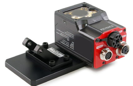
LUMIMAX® Montageplatte LMP-SR1000 SR2000 | Art.Nr.: 105.0002.06 für SQ40/FL, SQ80/FL, Spot3W, Spot5W/FL LSB50/FL, LSB100/FL und LSR24/FL-Serien