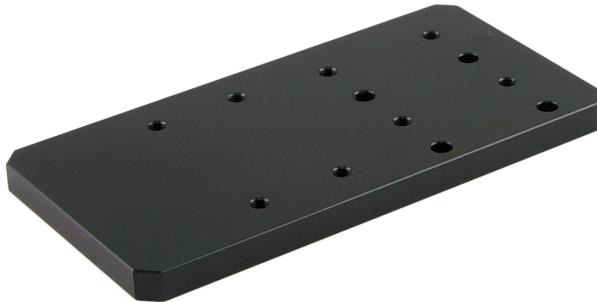
LUMIMAX® Adapterplatte LAP-SR1000 SR2000 Art.Nr.: 105.0002.05