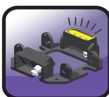
Montagesystem auf Seite 217 im Hauptkatalog