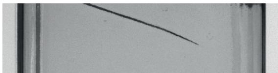
Drehlageerkennung einer Glasflasche im Durchlicht anhand einer Kante im Glas

Aber auch zur Abbildung transparenter und semitransparenter Objekte eignet sich eine diffuse Durchlichtbeleuchtung. So kann beispielweise beim Befüllen von Flaschen und Gläsern der Füllstand überprüft werden. Dies funktioniert selbst bei durchsichtigen Flüssigkeiten wie Wasser mit langwelligem Licht. Eine weitere Aufgabenstellung für diffuse Durchlichtbeleuchtung ist die kontrastreiche Darstellung von Defekten oder Merkmalen in durchscheinendem Glas oder Kunststoff.